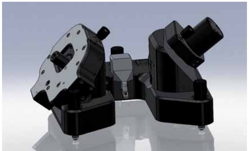
Рис.2. Модель сканирующего зондового микроскопа "ФемтоСкан" новой версии (Центр перспективных технологий)

Программа опережающей профессиональной переподготовки позволяет готовить кадры, способные организовывать техно-