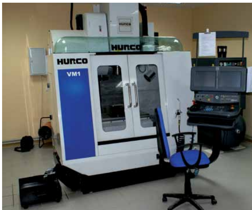
Рис.4. Вертикальный обрабатывающий центр HURCO VMX1 с ЧПУ (совместный проект МГУ имени М.В.Ломоносова и Академии биосенсоров)

Именно поэтому на ярмарки вакансий, проводимые в МГУ имени М.В.Ломоносова, съезжаются в поисках нужных выпускников представители мировых лидеров хай-тека из стран Европы, США, Японии и Южной Кореи, где уже успешно внедрена в жизнь цепочка "Университет-Завод". Эффективно работает и обратная связь "Завод-Университет", когда заводы заказывают научные исследования в университетах.